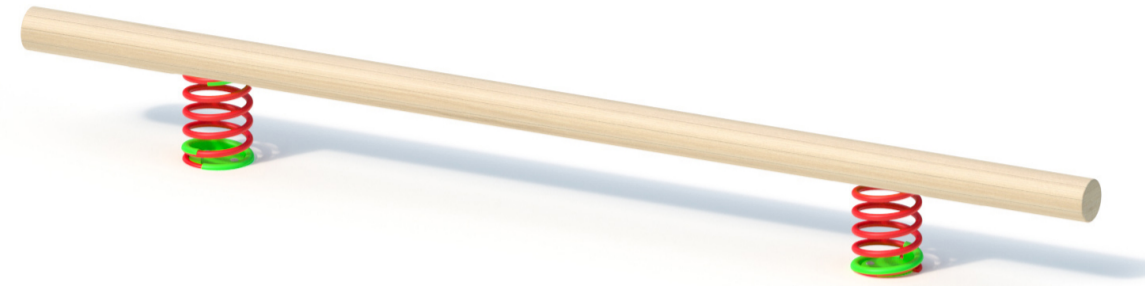
2. evenwichtsbalk (bestaand)